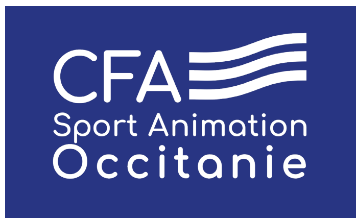
En blanc : utilisable sur fond foncé

Si vous souhaitez utiliser le logo du CFA pour une impression sur textile ou de grande taille, contactez le CFA pour obtenir le logo au bon format et en bonne résolution, en précisant dans l'objet : « demande logo communication ».