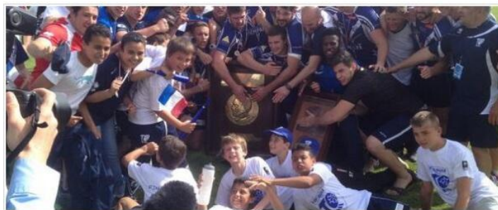
Le Toulouse Olympique XIII, nouveau Champion de France en seniors et juniors -TO XIII

Ce samedi 10 mai, le TO XIII a remporté le championnat de France face à Lézignan (38-12) après avoir remporté la Coupe de France.