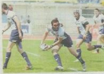
Les juniors toulousains visent eux aussi le doublé.

demie-finale, les Limouxins ont réalisé une excellente rencontre face à Saint-Estève XIII catalan. Cette équipe monte actuellement en puissance. Le groupe est averti. Cette finale du championnat ne va pas ressembler à celle de la Coupe.