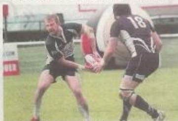
Bromley ici en demi-finale contre le TO, son ancien club.

L'avis de l'entraîneur-joueur de Villeneuve-sur-Lot.