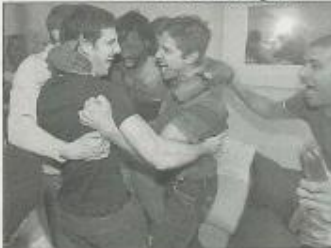
Les Dunkerquois, champions pour la première fois de leur histoire.