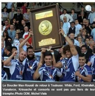
Le Bouclier Max-Rousié de retour à Toulouse. White, Ford, Kheirallah, Vunakece, Kriouache et consorts ne sont pas peu fiers de leur triomphe.

14 ans après, le Bouclier Max-Rousié revient dans la Ville rose