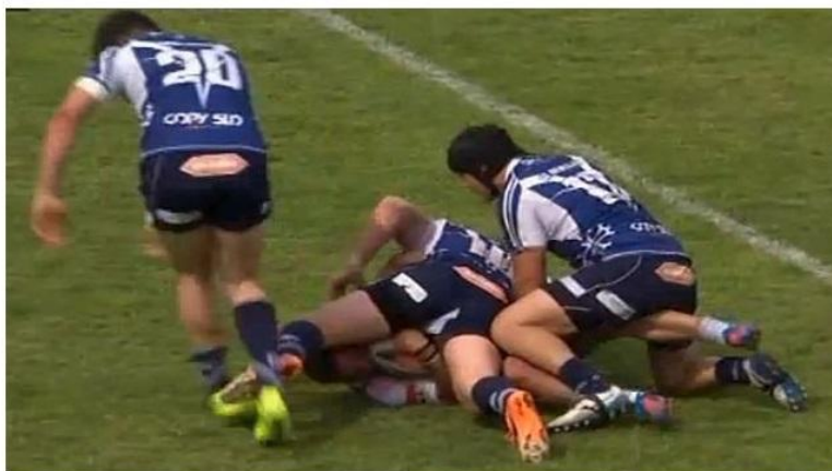
Perpignan - Lézignan battu par Toulouse en finale du championnat de France Elite du rugby à XIII, le FCL écrasé par les Toulousains - 10 mai 2014.

Par Fabrice Dubault | Publié le 10/05/2014 | 16:51, mis à jour le 10/05/2014 | 18:09