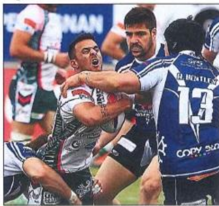
Recueilli par B. O. Anthony Carrère et Lézignan ont buté sur un mur.

C'est ouais, on le savait, il faut faire le match parfait. Après, il faut se souvenir de là où l'on vient. Personne ne nous attendait en finale cette saison et l'équipe s'est montrée performante pendant la Poule des as. Nous avons un groupe jeune, très jeune et il faut les féliciter pour leur saison.