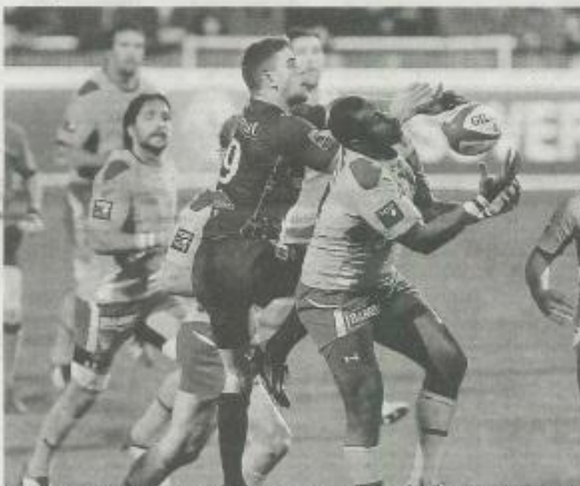
Kokkori - Sivivatu adversaires demain avant d'être partenaires la saison prochaine.

Privé, ce sont des bains de soleil interrompus, parfois, par des départs, derniers semaines. L'ailier Black (32 ans, 45 sel.) avait mal lue, voire cartonné dans le creux de la vallée d'une saison marquée par l'annonce précoce de son départ à Castres. « Mais qu'il a eu un passage », concède-t-il juste l'entour des trois-quarts Francis. « Mais j'ai l'impression que le monde, ça c'est, et le plus important c'est voir maintenant », ajoute-t-il en marchant sur des ors. Il est sur le chemin du retour à Clermont, où il a déjà commencé à aller auparavant.