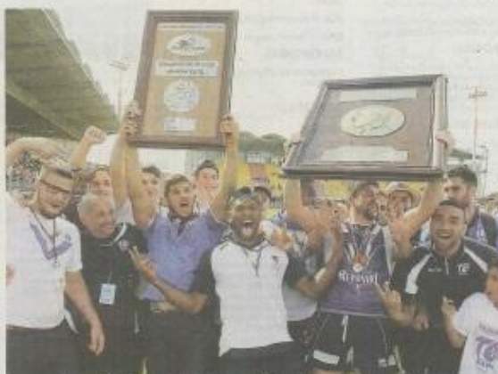
Deux boucliers la même journée. Juniors et seniors mêlés. La joie totale.

Le vainqueur de la Coupe et du championnat s'est incliné à trois reprises en championnat à domicile : lors de la première