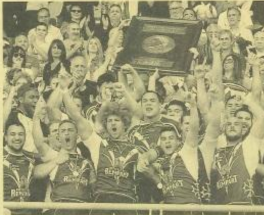
Les Toulousains ont décroché face à Lézignan leur cinquième titre de champion de France.

ADMINISTRÉS, LE SORCIER Cette finale, là l'est mûrie de bout en bout. D'ailleurs, le score (30-12) est cet écart de + 26 le troisième plus gros écart de l'histoire confirmant la large supériorité toulousaine sur son rival lézignais. Tactiquement, les hommes de Sylvain Houles ont véritablement évolué un ton au-dessus. Défensivement c'est un véritable étau qui s'est exercé sur les intentions andoises. Dans les stratégies de jeu, les électron libre de ce bloc lézignais d'ici se sont scindés en deux. La victoire comble de bonheur le tout jeune entraîneur Sylvain Houles : « Le groupe a respecté à la lettre les consignes. Les plans de jeu ont été appliqués. La défense que nous avons mise en place a été aussi la clé du succès. En prenant assez vite la tête au score, nous nous sommes facilités les choses. Ainsi, j'ai eu des joueurs exceptionnels et extraordinaires. Ils ont tous cet esprit au service du collectif. Ceux qui n'étaient pas sur la feuille