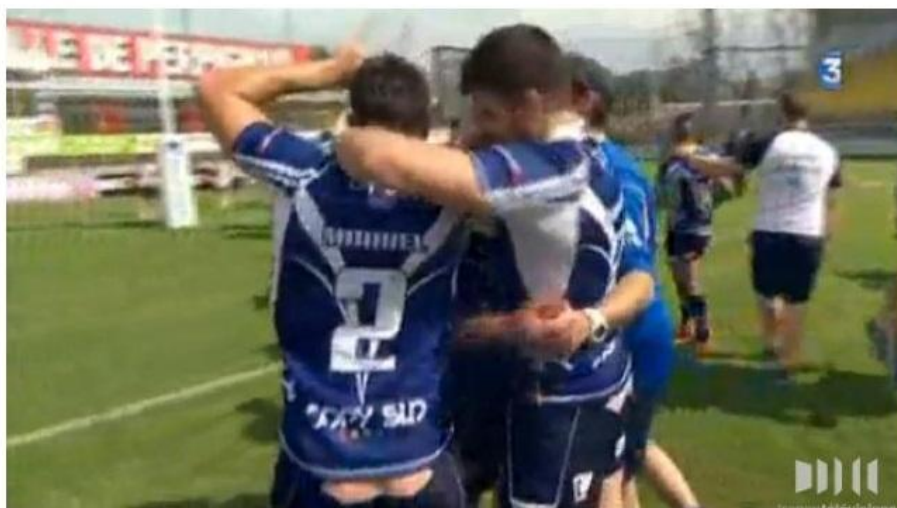
Le TO XIII écrase Lézignan et signe le doublé coupe-championnat.

« Le doublé est impossible », rappelle souvent un célèbre entraîneur toulousain. Visiblement, il ne l'est pas en rugby à XIII. Les rugbymen du Toulouse Olympique XIII ont en effet signé un petit exploit en signant le premier doublé coupe-championnat de leur histoire.