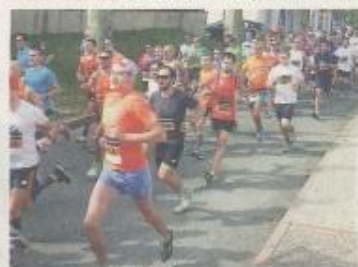
224 coureurs ont pris le départ vers 10 heures.