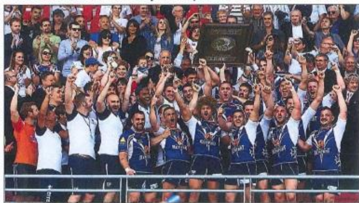
Le TO a marché sur l'élite cette saison et donne rendez-vous en 2014 pour son entrée en Super League II.

Et inopinément, les coéquipiers de Seb Planas rejoignent un deuxième essai par l'un-