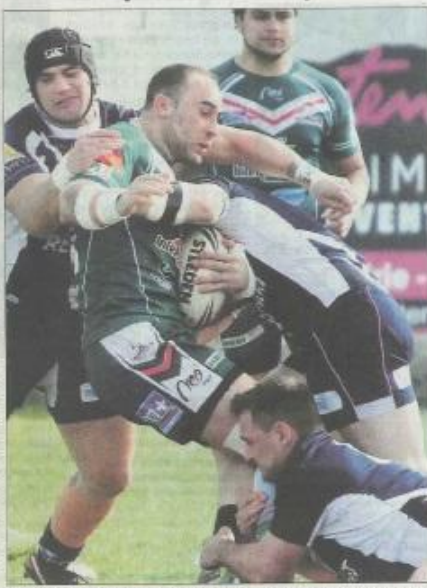
Le FCL devra résister au TO pour gagner le titre une 5e fois en 7 ans.