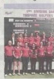
Les Toulousaines et leur encadrement sur le podium.

L'exploit des filles du GC Toulouse est d'autant plus grand puisque c'est la première année que le club toulousain arrive à ce niveau de la compétition. De plus, toutes les participantes à cette édition 2014 du championnat de France de golf amateur