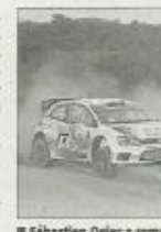
Sébastien Ogier a remporté les deux premières spéciales.

Le Gallois Elfyn Evans (Ford Fiesta RS) s'empare de la 4 e place, à près de 4 minutes du