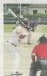
Quatre jours de baseball attendent les passionnés.

Poule B : Sénart Templiers, Stade Toulousain Baseball, Paris Université Club et Savignysur-Orge Lions.